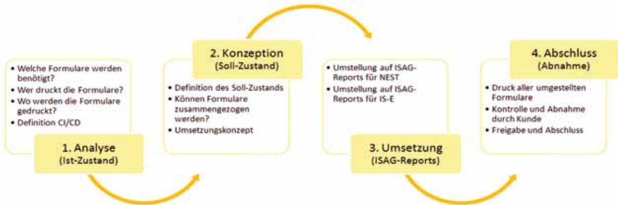
Der Umstellungsprozess auf ISAG-Reports