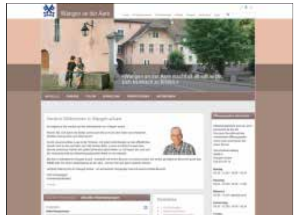
Gemeinde Wangen an der Aare