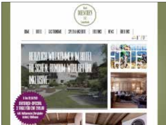
Sporthotel Dieschen, Lenzerheide