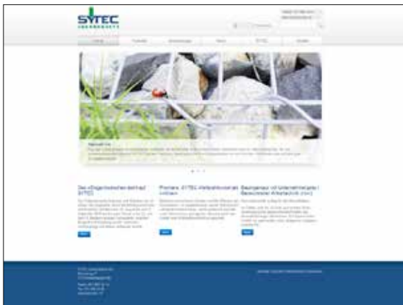
Sytec Bausysteme AG, Niederwangen

Die anthrazit ag aus Winterthur, hat sich auf die Entwicklung von App's für Gemeinden, Energieversorger und KMU's spezialisiert. Dank der Partnerschaft mit der Talus Informatik AG, profitieren Sie von direkten Schnittstellen in Ihre Internet-Präsenz inkl. Online-Kundencenter. Die Zweifachpflege fällt gänzlich weg. Seit letztem Monat ist die anthrazit ag neu eine weitere Kooperation (nach MeteoneWS AG, homegate AG, Mobility AG, Schweizer Bauernverband und vielen mehr) mit der Swisscom AG eingegangen. Dadurch kann künftig auch das lokale Gewerbe sein Angebot in der App publizieren. Für nähere Informationen wenden Sie sich an Ihren Verkaufsberater.